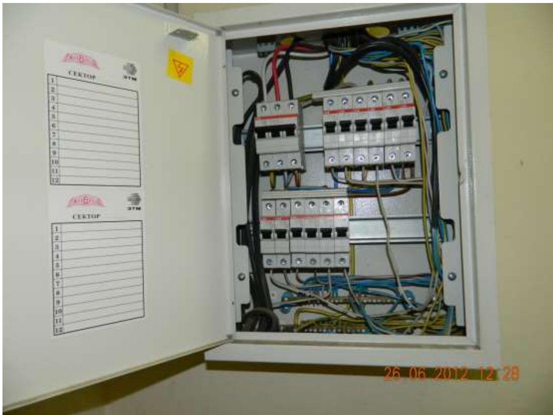
Фото 7. Отсутствие маркировки в электрощитах.