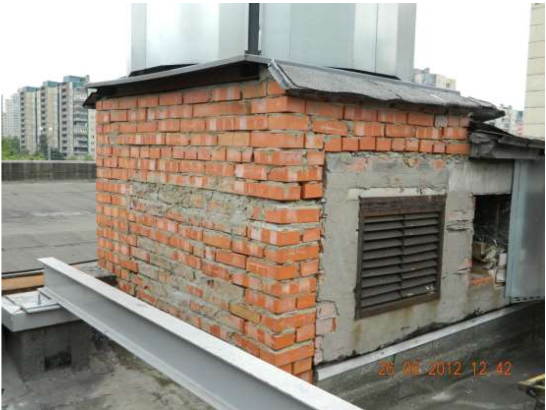
Фото 8. Дефекты кирпичной кладки.