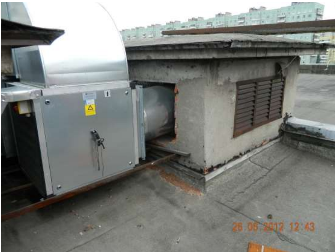
Фото 11. Незавершенные работы по вентиляции.