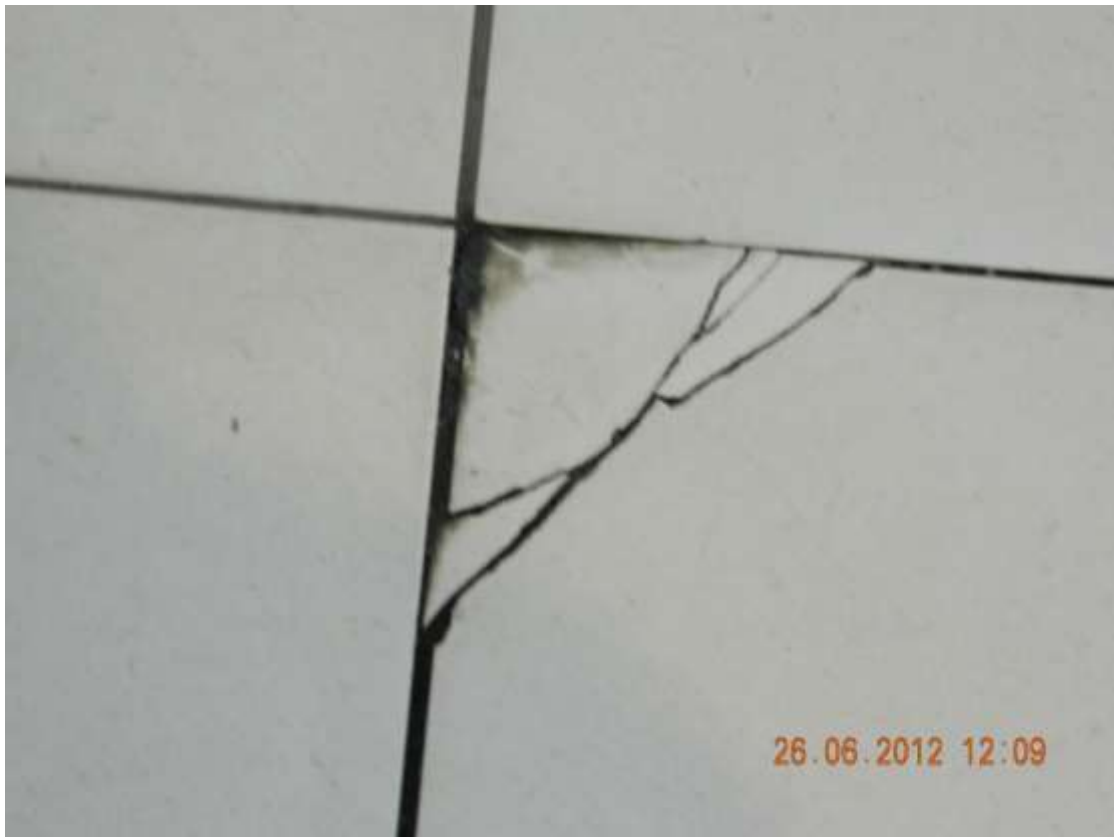
Фото 3. Полы в торговом зале.