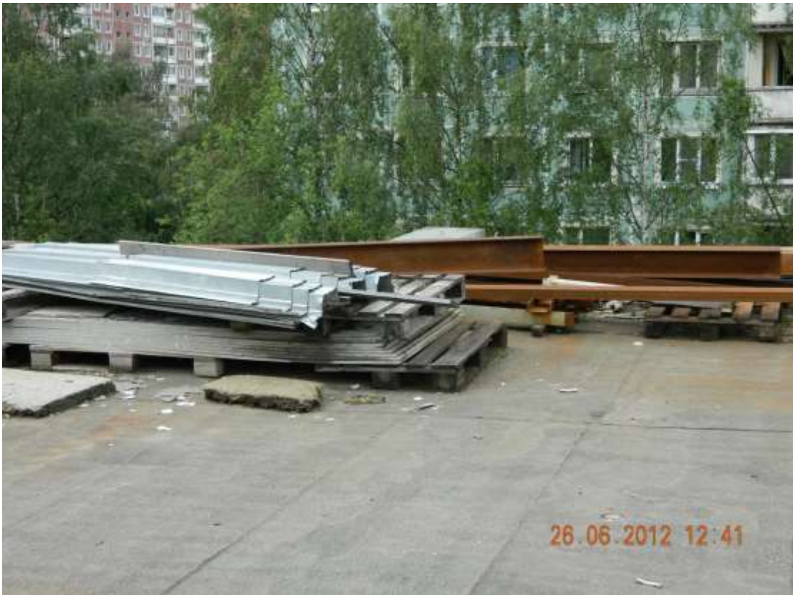
Фото 9. Остатки строительных материалов на кровле.