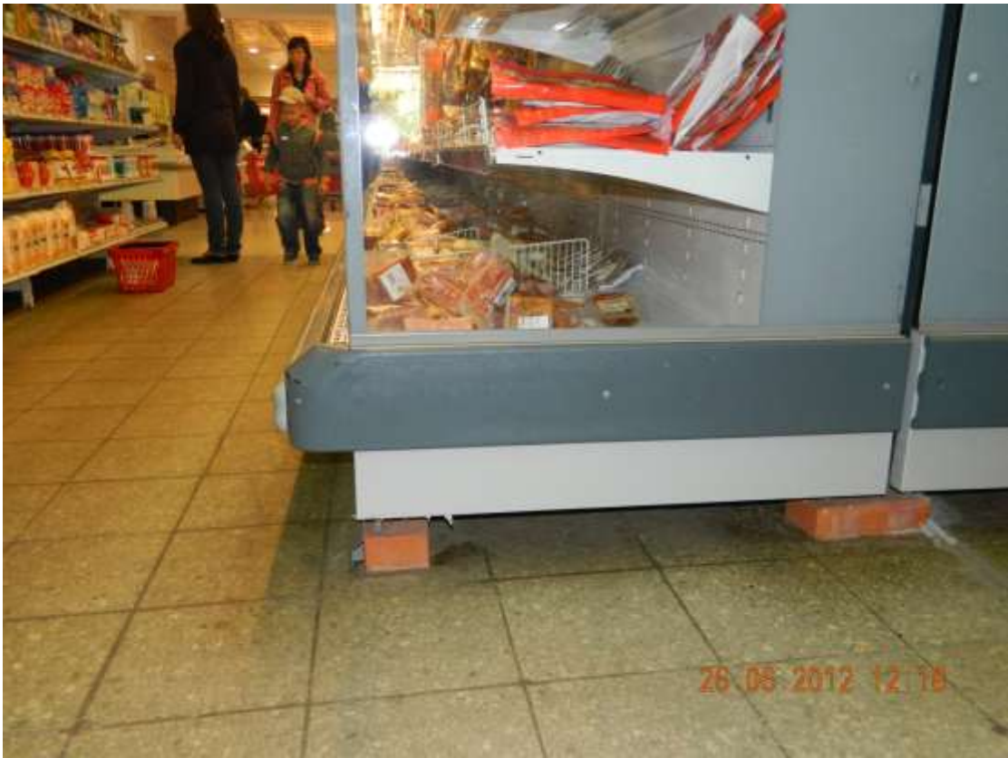
Фото 5. Полы в торговом зале.