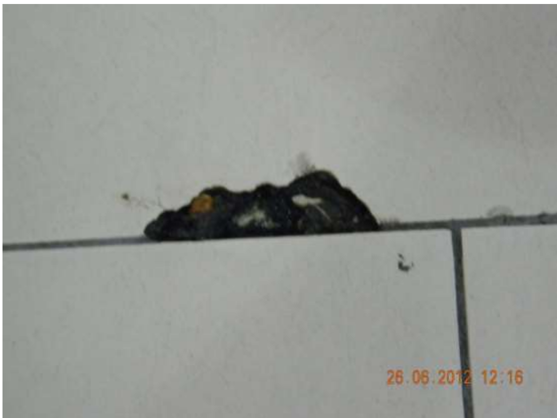
Фото 4. Полы в торговом зале.