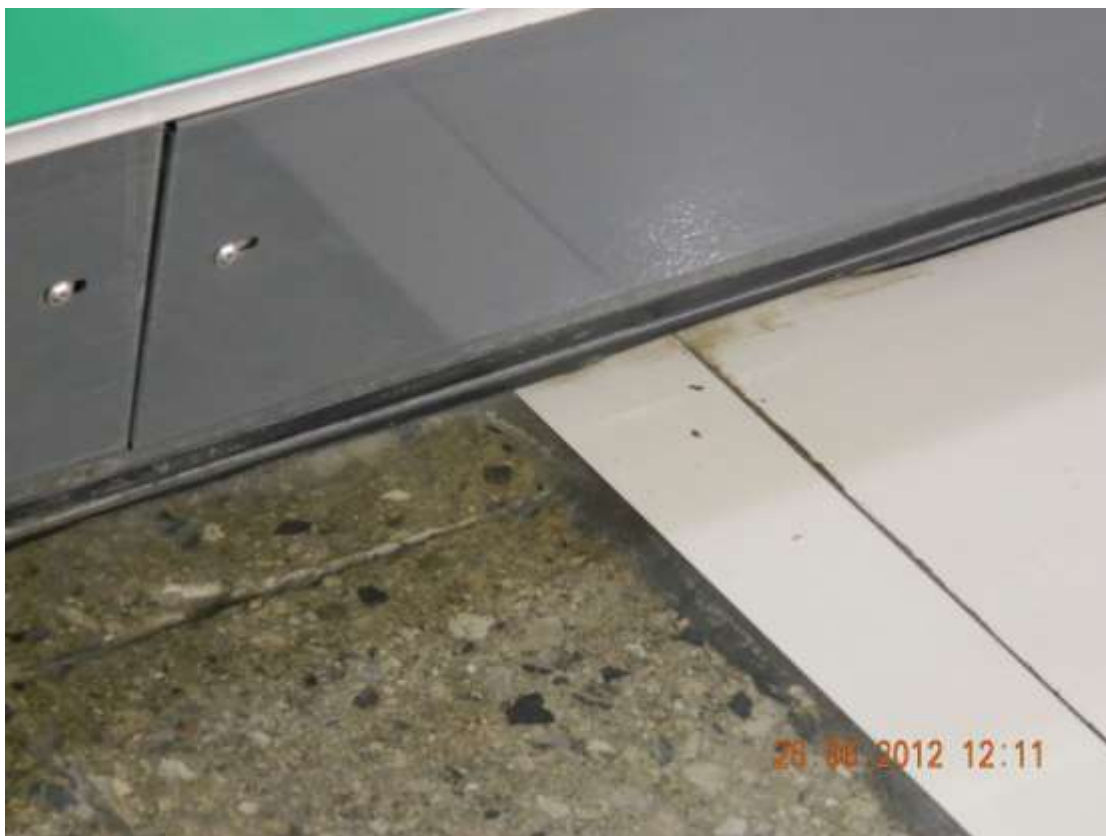
Фото 2. Полы в торговом зале.