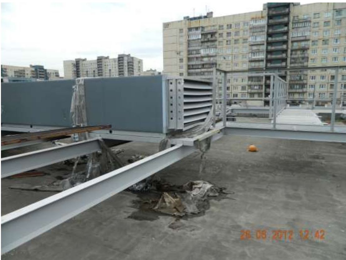
Фото 12. Незавершенные работы по вентиляции.