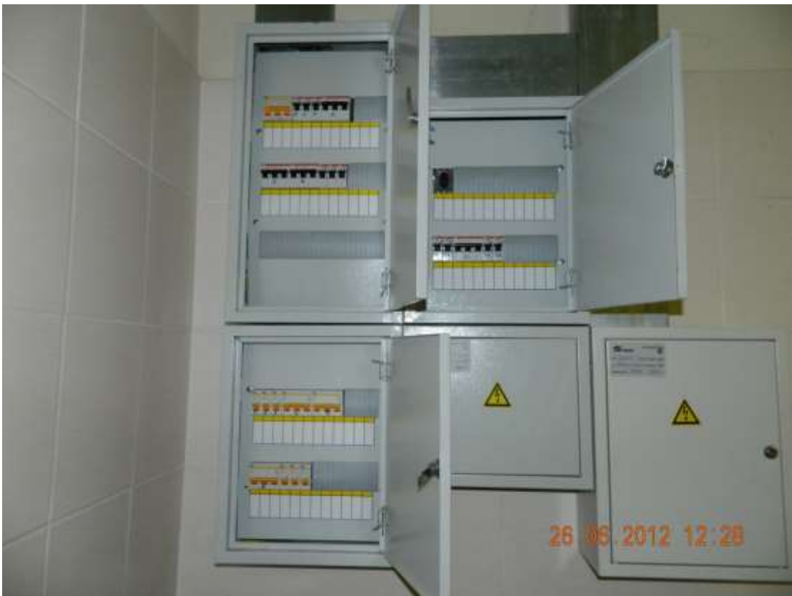
Фото 6. Отсутствие маркировки в электрощитах.