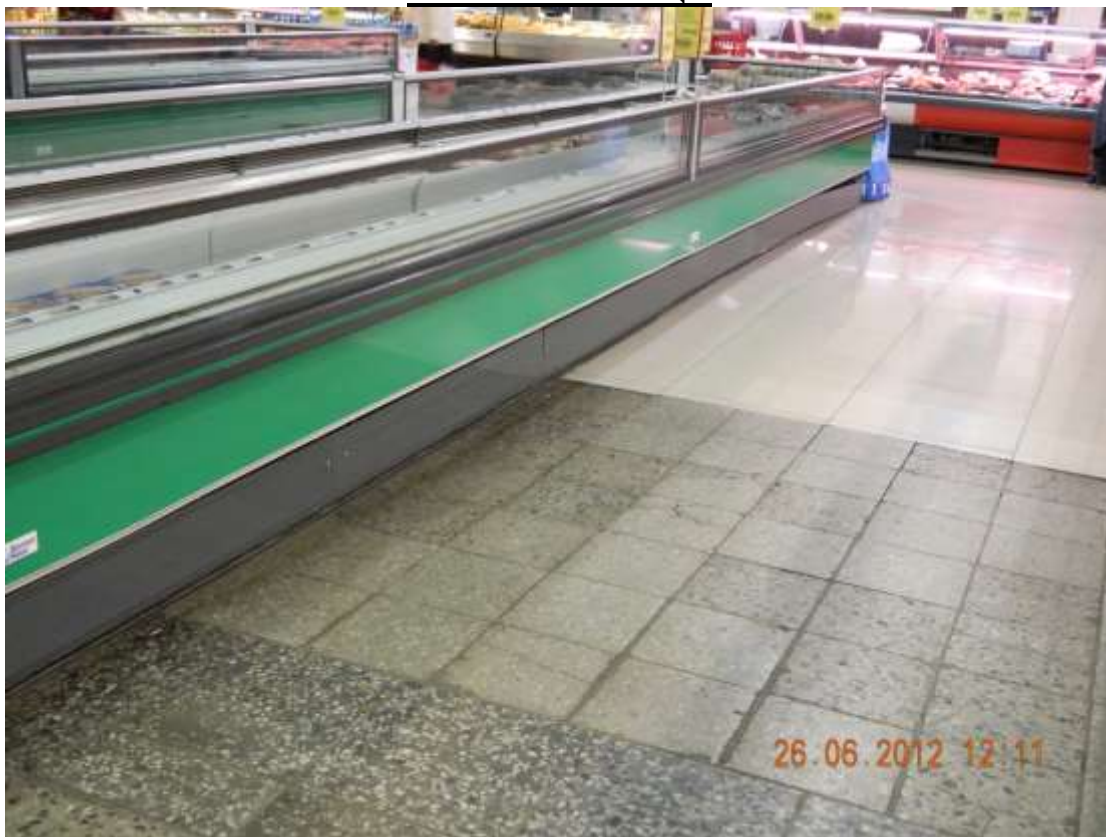
Фото 1. Полы в торговом зале.