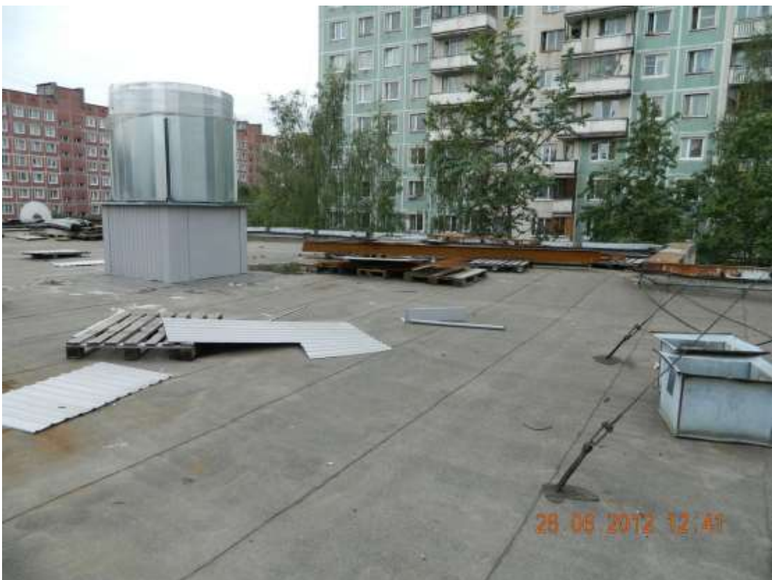
Фото 10. Остатки строительных материалов на кровле.